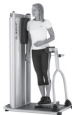
Training der lateralen Rumpf-Muskulatur