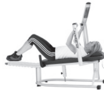
Zielgerichtetes Training des M. transversus