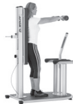
Stabilisation im aufrechten Stand