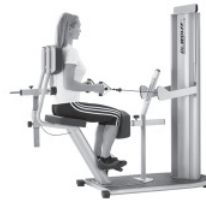
Stabilisation im Sitzen

Erlernen von Kombinationsübungen für Haltungsstabilisierung und Bewegungsmuskulatur.