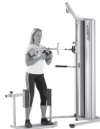
Training der Rotation