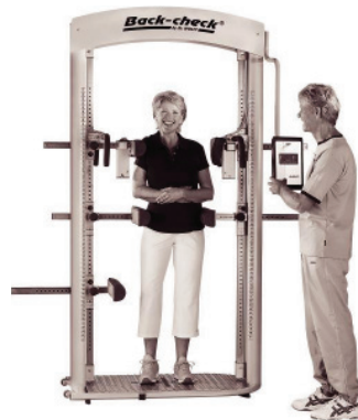
Diagnostik und Verlaufskontrolle mit Back-Check®